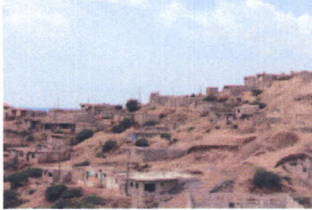
Bairro Alto da Glória

Nachbarschaftshilfe. Unter den BewohnerInnen gibt es starken Zusammenhalt und die Identifikation der Gemeinschaft mit dem Ort drückt sich in einer künstlerischen Intervention aus in Form einer Christusstatue, die von einem lokalen Künstler auf einer Felsnadel errichtet worden ist.