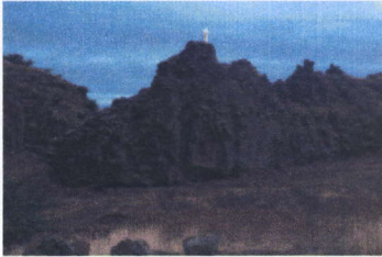
Bairro São Paulo, Praia