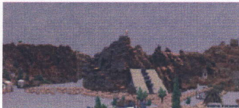
Projekt Kapelle für Quartier São Paulo, Praia: Vesna Pecanac