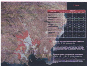
Praia: informelle Siedlungsgebiete vor 1991 (weiß) und 1991 bis 2000 (rot).

Die kapverdianische Regierung hat 2008 das engagierte Programm "Casa para Todos" (Wohnen für Alle) initiiert, das helfen soll, das Wohnungsproblem zu lindern. Es folgt dem Prinzip des Sozialen Wohnbaus nach europäischem Muster und ist für Menschen mit regelmäßigem Einkommen ausgelegt. Das Programm wird über Kredite (4) aus Portugal und Brasilien finanziert.