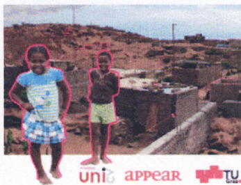
Plakat zum Projekt. Gestaltung: Adina Camhy