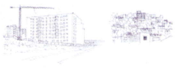
formell (Programm Casa para todos) informell (bairros espontâneos)