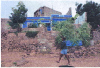
mein Haus minha casa

Ausstellung der örtlichen Politik und den BewohnerInnen der Gebiete vorgestellt werden.