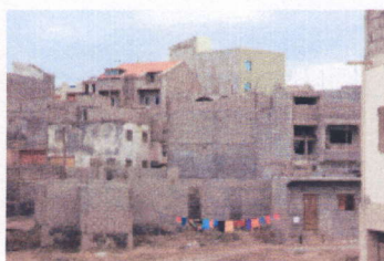
Spontane Siedlungen in Praia.

InforCidade ist ein Gemeinschaftsprojekt der TU Graz, Institut für Wohnbau und der Universität von Kap Verde (UniCV), Departamento de Ciências e Tecnologia, das im Rahmen des akademischen Partnerschaftsprogramms appear stattfindet und vom Österreichischen Austauschdienst OeAD gefördert wird.